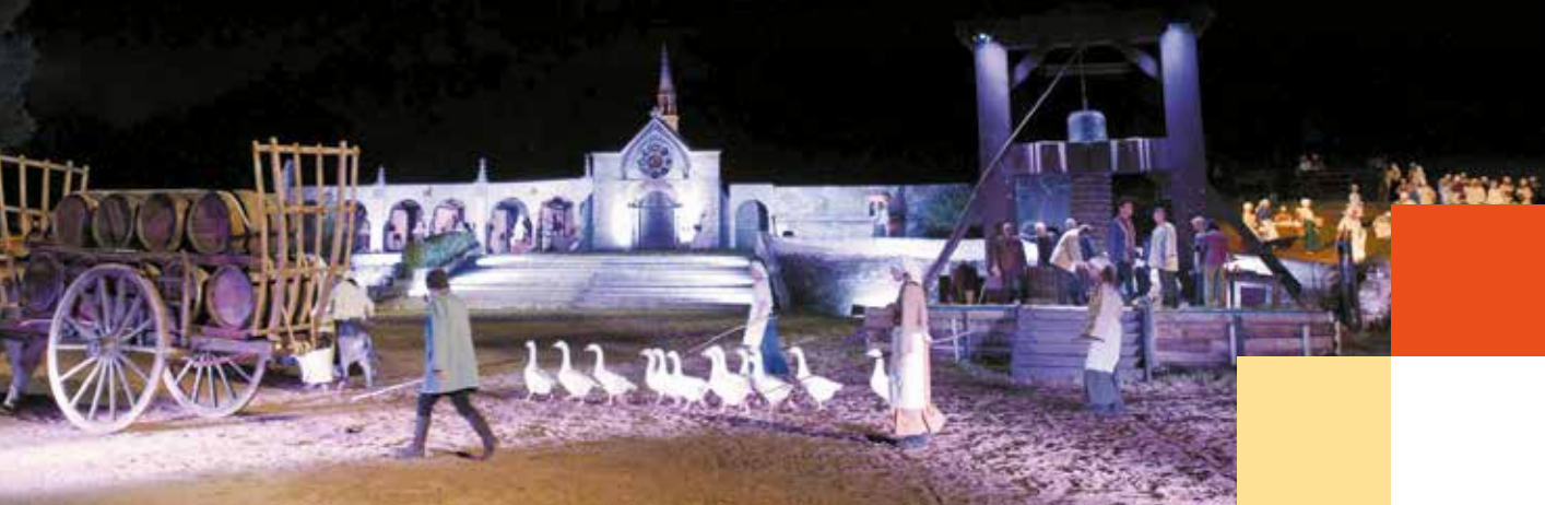
La bataille de Castillon

Des festivals labellisés Scènes d'été, vous proposent leur spectacle dans de nombreuses villes de Gironde.