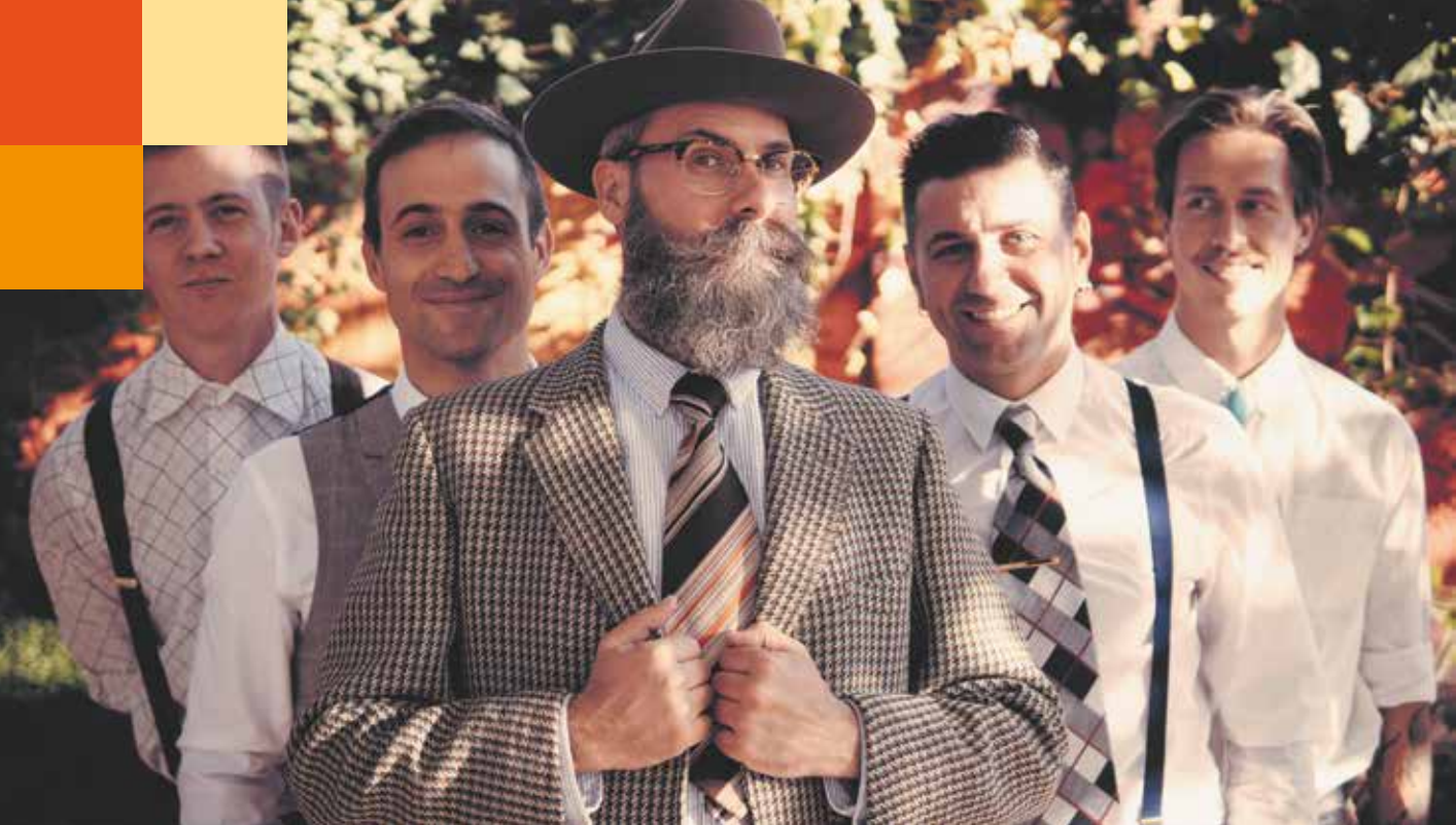
The 'O' City Vipers